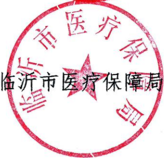
临沂市医疗保障局