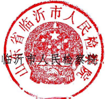
临沂市人民检察院