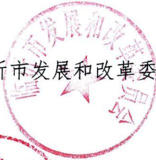
临沂市发展和改革委员会